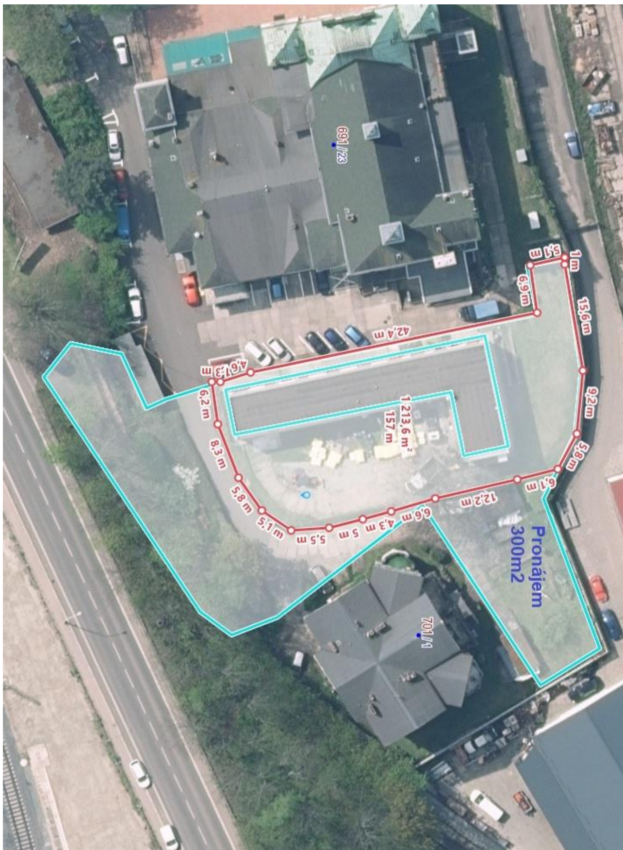
Příloha č. 2 ke Zřizovací listině organizační složky statutárního města Děčín Středisko městských služeb